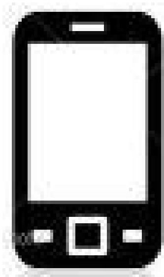
Image de portable pour envoyer les bonnes nouvelles

Ask : réseau social qui permet aux utilisateurs de recevoir des questions de la part d'autres utilisateurs identifiés ou d'utilisateurs anonymes.