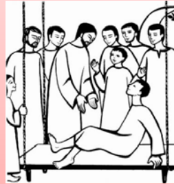
Luc 5, 17-26