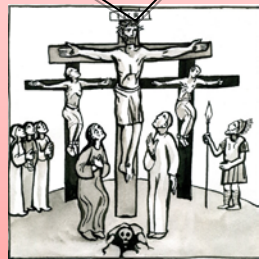
Luc 23, 32-34