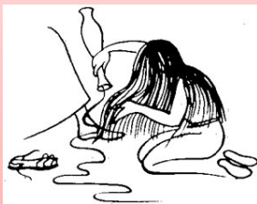
Jean 12, 1-8