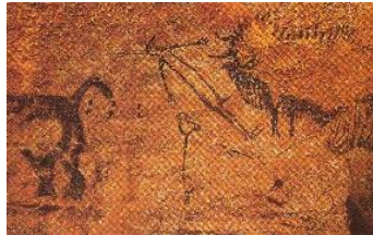
« L'homme de Lascaux ».

On y voit un bison, un « homme », un oiseau, un rhinocéros.