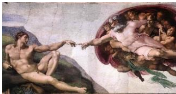
Michel Ange : « la création »

Un message qui apparaît sur trois affiches coup de poing : un ours polaire qui fond comme banquise au soleil, un singe en train de prendre feu et un cerf aux abois. Ces images illustrent les ravages de la déforestation, de la pollution ou encore les conséquences du forage dans les zones polaires.