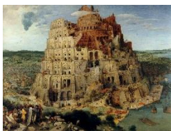
Bruegel : « la tour de Babel »

Ce qui a pose question c'est l'agencement de ces représentations, le fait que ces éléments semblent associés pour nous raconter une histoire ou simplement nous dire quelque chose. L'homme mystérieux qui figure au centre de ce panneau a été tout à tour vu comme un chasseur accidenté, un sorcier se préparant à la traque ou un chamane en transe.