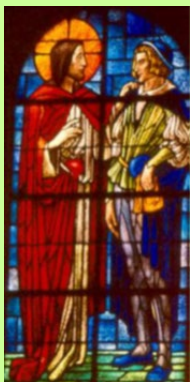
LE JEUNE HOMME RICHE