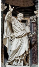
Statue de saint Pierre, dans l'église Santi Severino, Naples