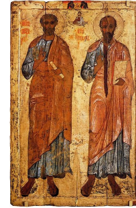
Apôtres Pierre et Paul, Belozersk icon