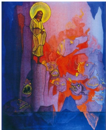
Sortie des enfers , par Nicolas Roerich