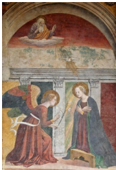
L'Annonciation , par Melozzo da Forti