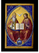
La Sainte Trinité, miniature des Grandes Heures d'Anne de Bretagne par Jean Bourdichon