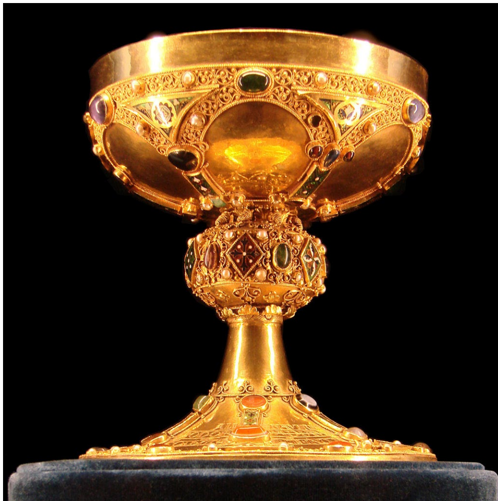
Calice du sacre, dit calice de saint Remi, Trésor de la cathédrale de Reims