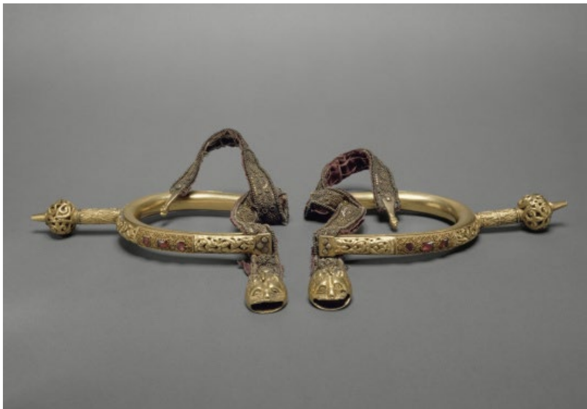
Paire d'éperons d'or du sacre des rois de France, dite de Charles V, Musée du Louvre