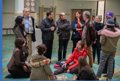
Formation au dialogue interreligieux, mars 2020